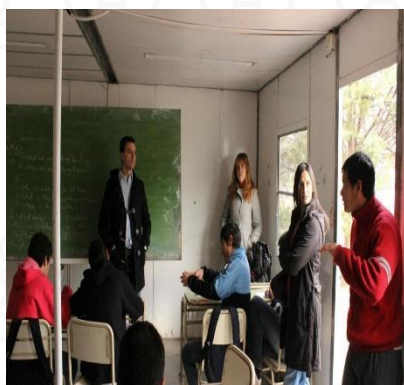
ESCUELAS EN CONTAINERS