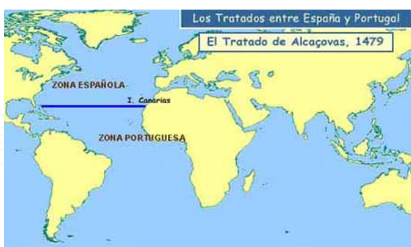
Figura 1. Tratado de Alcaçovas Toledo 1479

¿Cómo dividía la explotación de las rutas comerciales el tratado de Alcaçovas Toledo?, ¿de Este a Oeste o de Norte a Sur? ¿Qué isla se tomaba como referencia para establecer el límite de la línea demarcatoria del tratado de Alcaçovas Toledo? ¿Cómo dividía la explotación de las rutas comerciales y de las posesiones el Tratado de Tordesillas?, ¿de Norte a Sur o de Este a Oeste? ¿Quién se benefició con el Tratado de Tordesillas? Según la configuración espacial de Brasil en la actualidad, ¿se respetó el Tratado de Tordesillas? ¿Por qué?