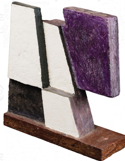
Yente (1948). Objeto [Celotex tallado y pintado, 31 x 30,3 x 10 cm].