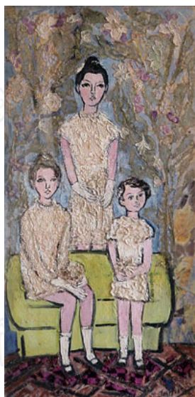
Yente (1968). Las tres hermanas [Bordados, encajes y óleo sobre cartón, 100 x 50 cm].