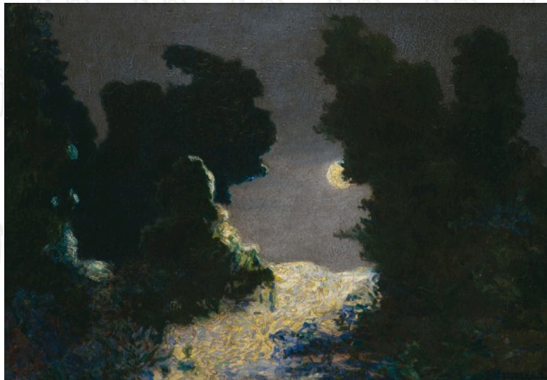
Malharro, M. (1909). Nocturno [Óleo sobre tela].