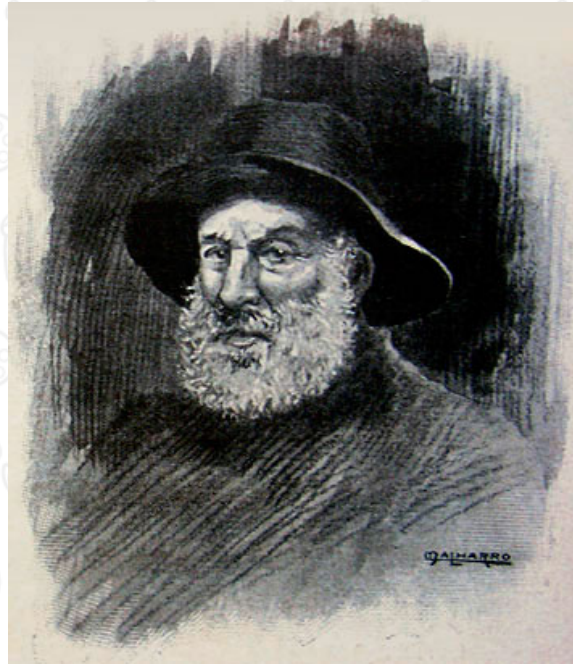
Malharro, M. (1902). El faro [Ilustración de libro].