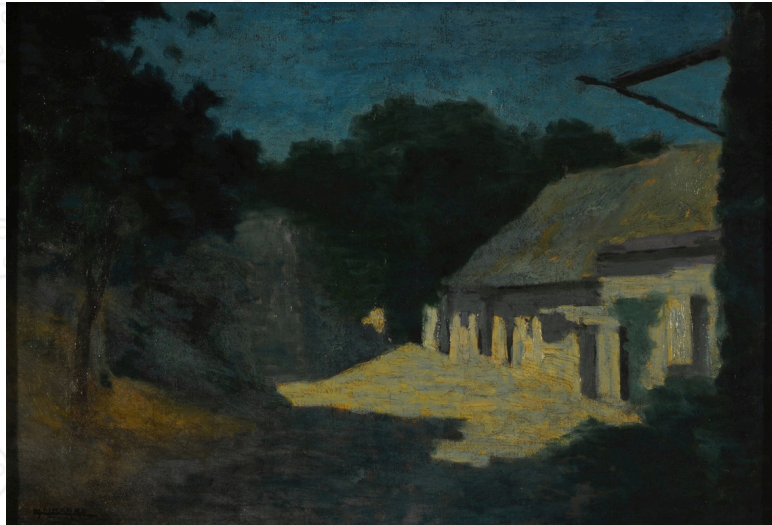
Malharro, M. (1910). Nocturno [Óleo sobre tela].