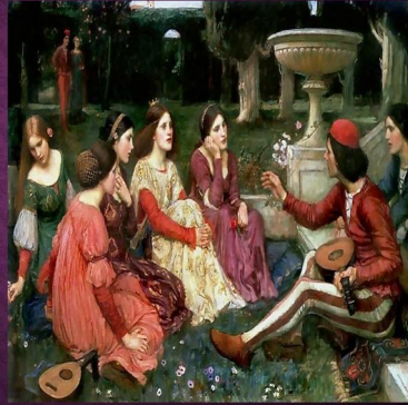
El Decamerón, de Giovanni Boccaccio (A Tale from Decameron por John William Waterhouse, 1916, Lady Lever Art Gallery, Liverpool). Disponible en

Fuente: Un historia para pensar. Editorial Kapeluz.